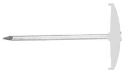
Гвоздь с шайбой NSB